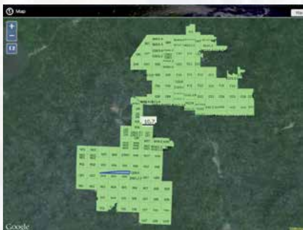
Cartographie des différentes plantations d'huile de palme grâce à un ArcGIS Service (ArcGIS desktop).